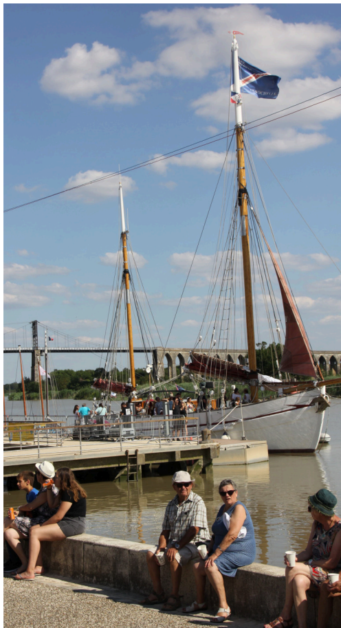
Le patrimoine local sera mis à l'honneur ce 14 juillet. E. NORMAND