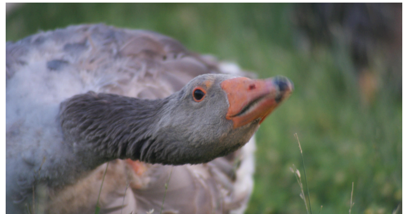
Loie du Marais poitevin a fait l'objet d'expertises génétiques dans le cadre d'une association de sauvegarde.

mal. Face à ce constat, le Cregene s'est donné pour objectif d'inventorier, de caractériser, de sauvegarder et de valoriser cette richesse territoriale locale pour répondre aux enjeux environnementaux, sanitaires et économiques futurs. Ainsi les membres du Cregene déterminent les spécificités de chaque animal et de chaque végétal afin de garantir la génétique de chaque ressource. Parmi les actions menées, il faut relever l'accompagnement pour la création de l'Association de sauvegarde des oies poitevines, à la suite du travail d'inventaire des élevages et d'expertise génétique sur la population d'oies. Notons aussi l'ap-