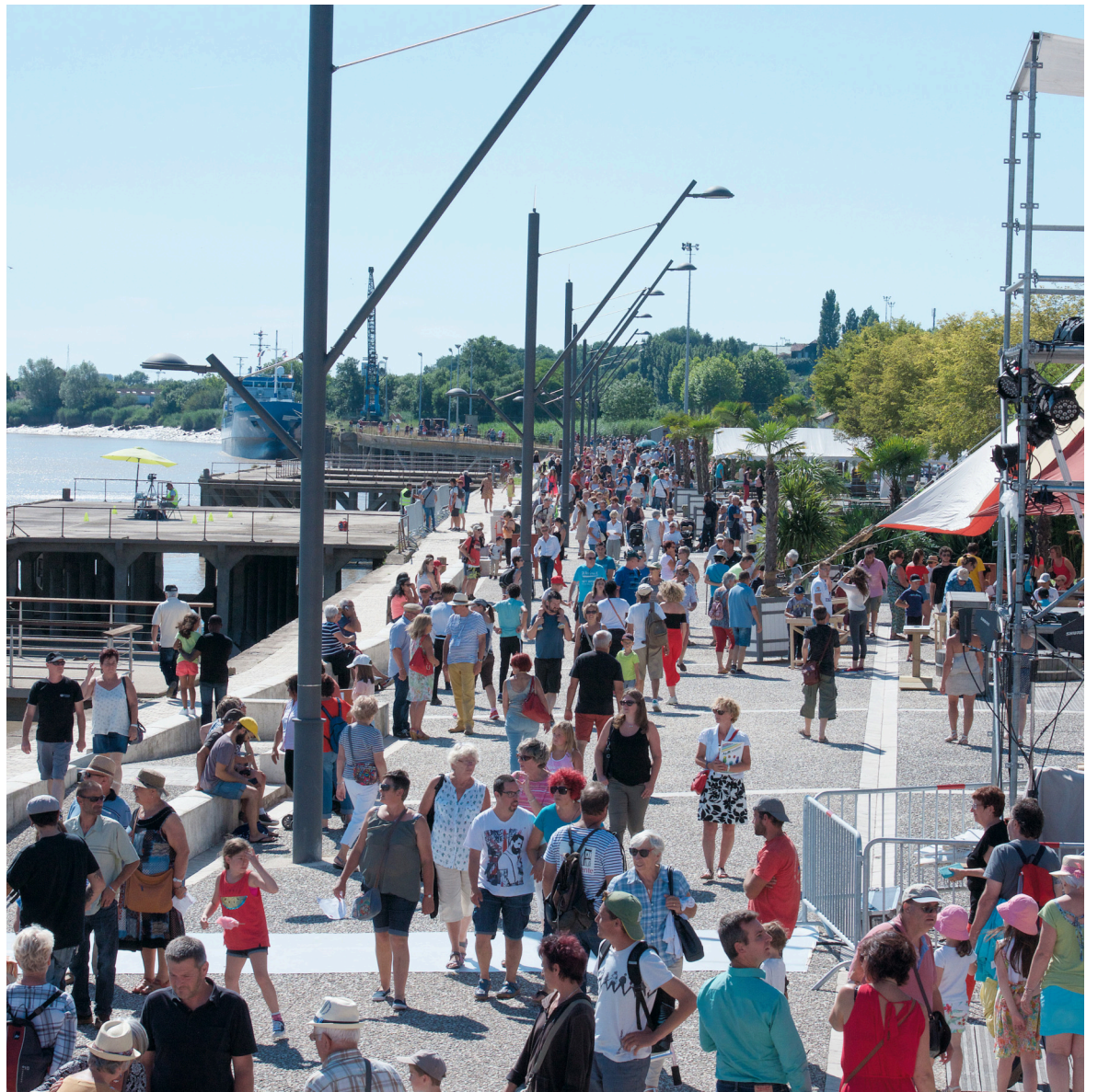
La Fête du fleuve permet au public de s'appropriier les quais de Tonnay-Charente. E. NORMAND