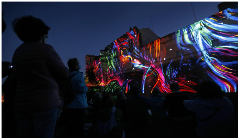
Une séquence de mapping vidéo remplacera le traditionnel feu d'artifice du 14 juillet.