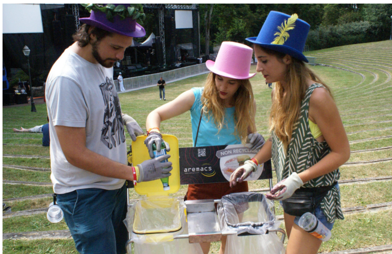
Les bénévoles d'Aremacs trient les déchets lors des festivals.

Parce que cette manifestation se veut populaire et festive avant tout, le public pourra assister, dès 18 heures, et jusqu'au milieu de la nuit, à une déambulation des artistes de la compagnie La Folie de l'Ange et leurs dômes poétiques. Pour découvrir l'histoire de Tonnay-Charente et de son activité économique, place à la visite « historico-hystérique » menée par l'ar-