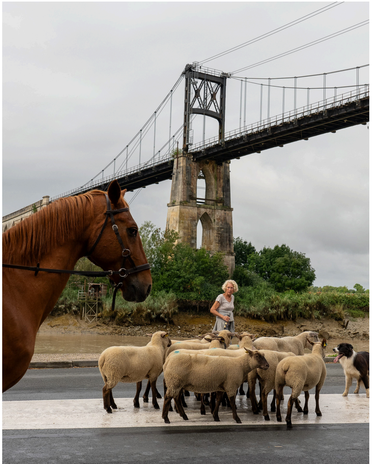
Une ânesse suitée, une jument trait poitevin suitée, une vache maraichine, des chèvres et lapins chèvres seront les stars de cette Fête de la ruralité. MAXIME FRANUSIAK