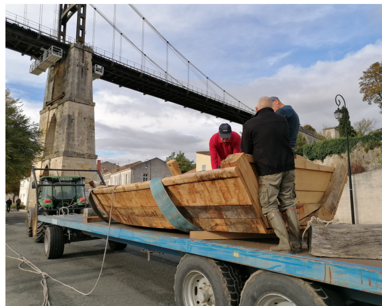
La barque a été immergée dans le fleuve, entre octobre 2023 et février 2024, afin de faire gonfler le bois. D.B.

Saint-Savinien, Taillebourg, Échillais ou encore Soubise ont fait part de leur intérêt de pouvoir accueillir à terme cet élément du patrimoine navigant fluvial. À l'image de « L'Hermione » associée à Rochefort, Tonnay-Charente a désormais son emblème nautique.