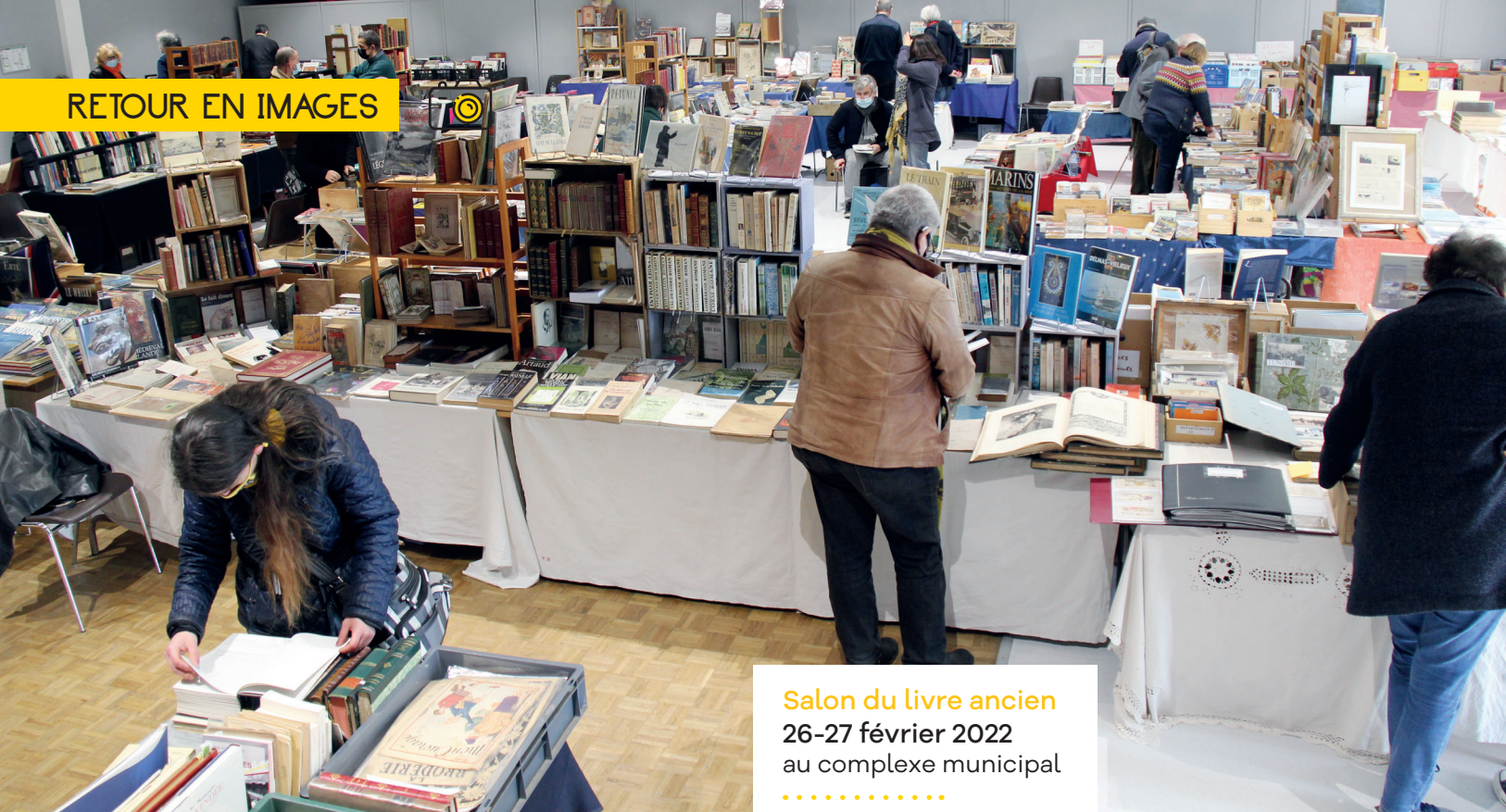
Salon du livre ancien 26-27 février 2022 au complexe municipal