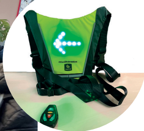
Remise de gilets directionnels à LED aux collégiens à vélo. 9 février 2022