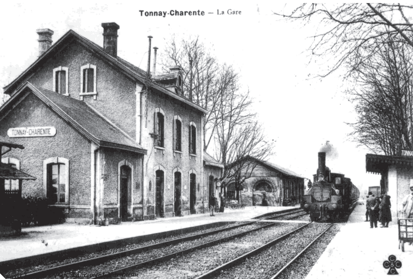
Tonnay-Charente – La Gare

La halte ferroviaire de Tonnay-Charente est aujourd'hui constituée de deux abris. C'était l'emplacement d'une véritable gare qui disposait d'un bâtiment destiné aux voyageurs avec logement de fonction à l'étage, d'une petite marquise et d'une halle à marchandises.