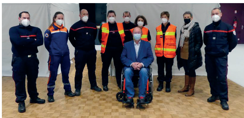
Visite du maire au centre de vaccination mobile Covid-19 du SDIS 17 au Complexe municipal. 19 janvier 2022