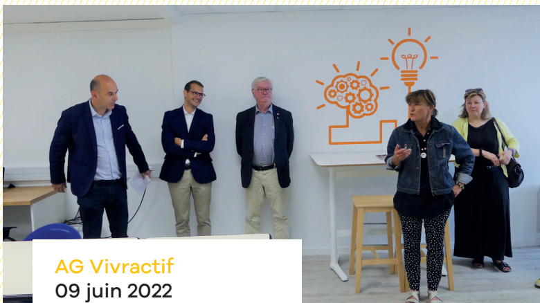
AG Vivractif 09 juin 2022 locaux 12 rue Alfred Nobel .....