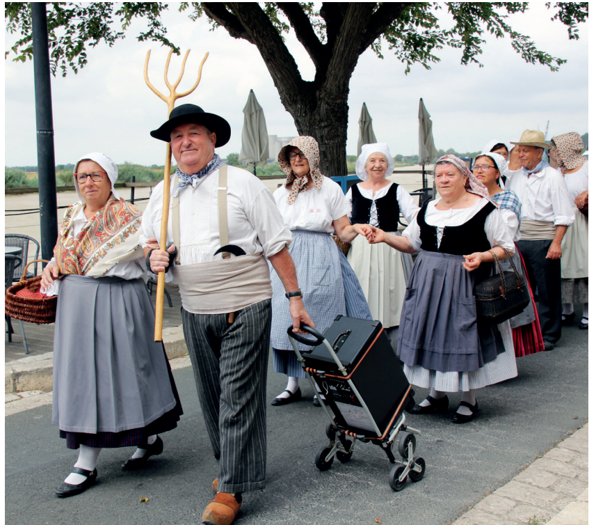
Fête de la ruralité 15 août 2022 au jardin des Capucins