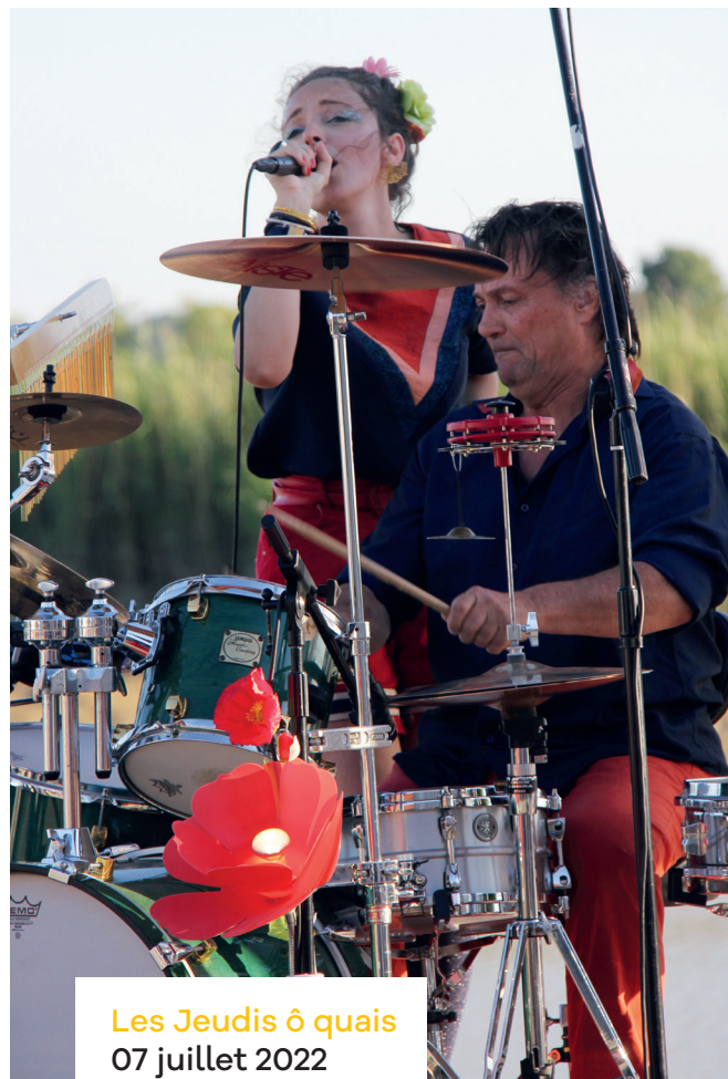
Les Jeudis ô quais 07 juillet 2022 sur les quais .....