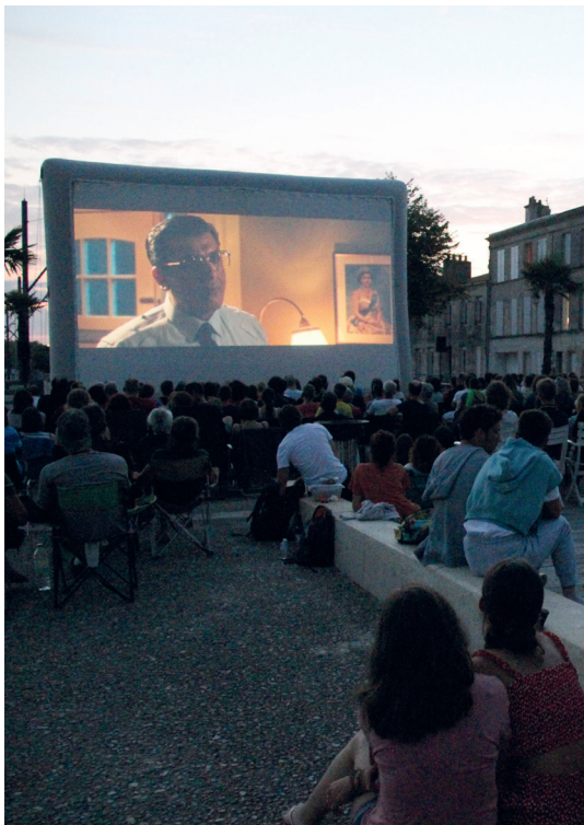
Les Jeudis ô quais 04 août 2022 sur les quais