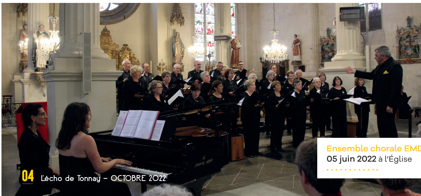
Ensemble chorale EMD 05 juin 2022 à l'Église .....