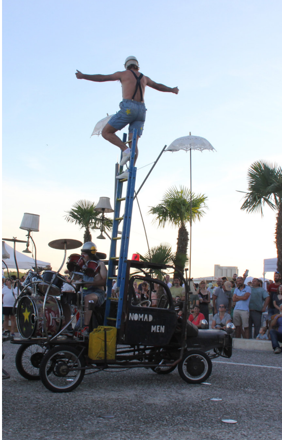
Tonnay fête sa Charente 14 juillet 2022 sur les quais