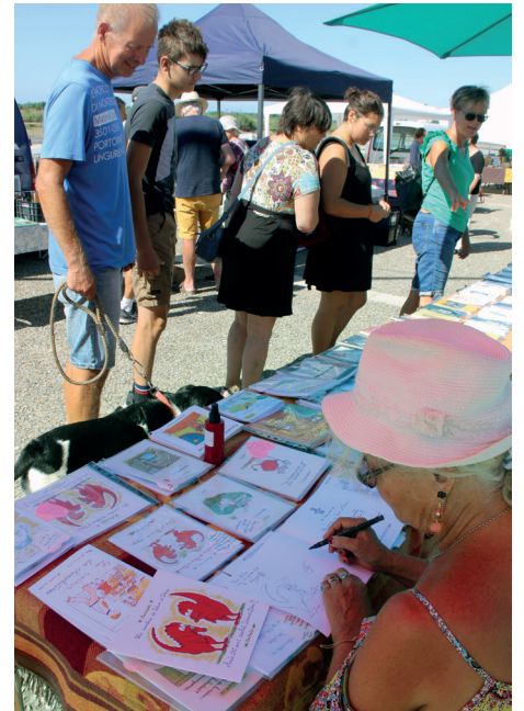
Marché aux livres 31 juillet 2022 quai de la Libération