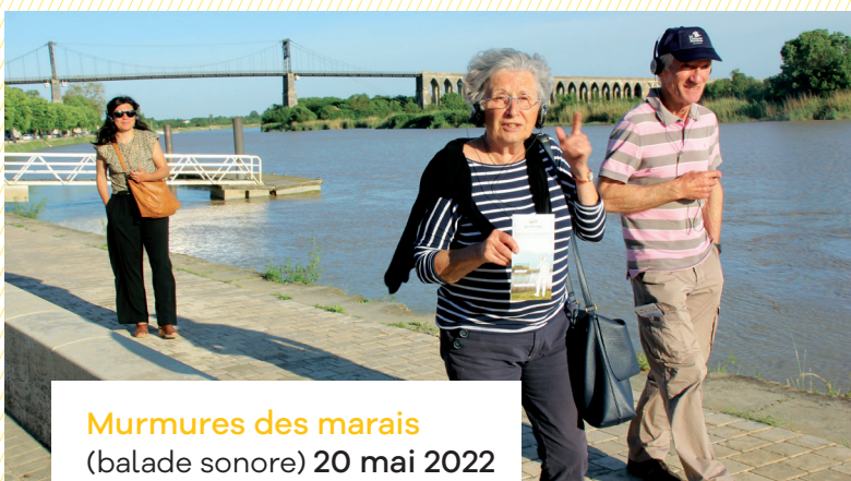
Murmures des marais (balade sonore) 20 mai 2022 Les Halles et sur les quais .....