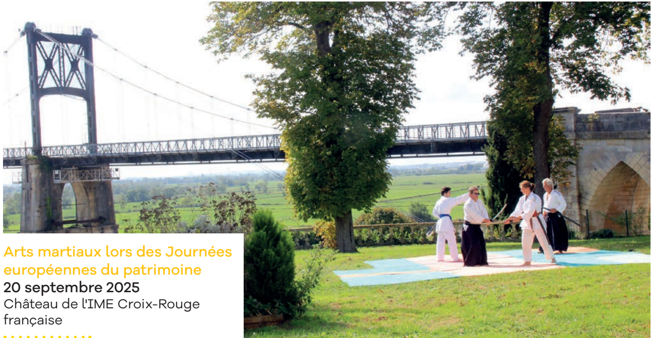
Arts martiaux lors des Journées européennes du patrimoine 20 septembre 2025 Château de l'IME Croix-Rouge française .....