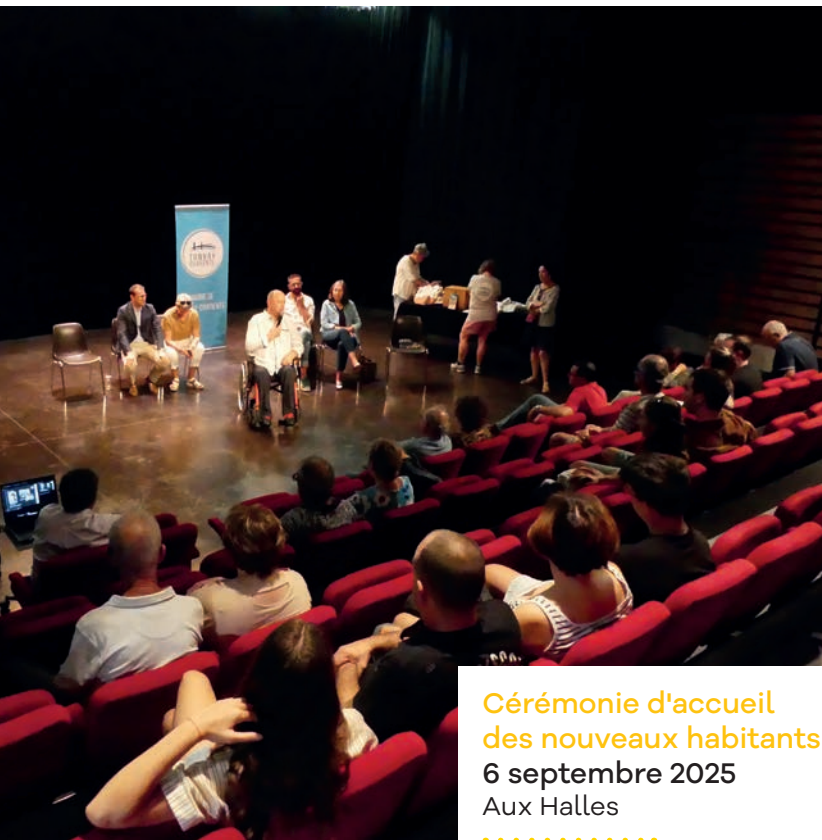
Cérémonie d'accueil des nouveaux habitants 6 septembre 2025 Aux Halles .....