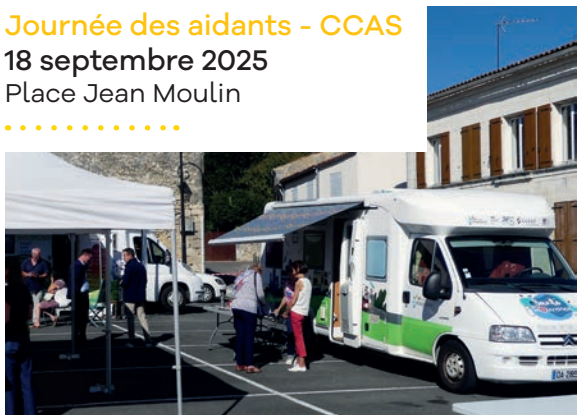
Journée des aidants - CCAS 18 septembre 2025 Place Jean Moulin .....