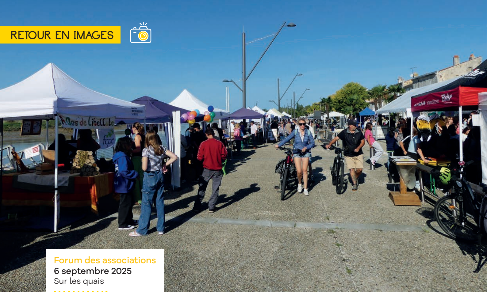
Forum des associations 6 septembre 2025 Sur les quais .....