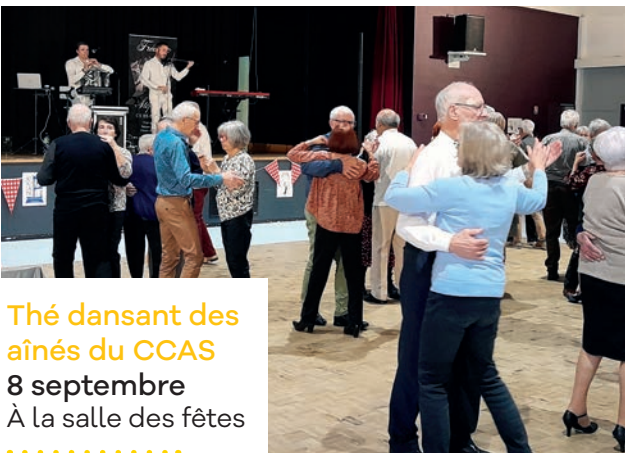
Thé dansant des aînés du CCAS 8 septembre À la salle des fêtes .....