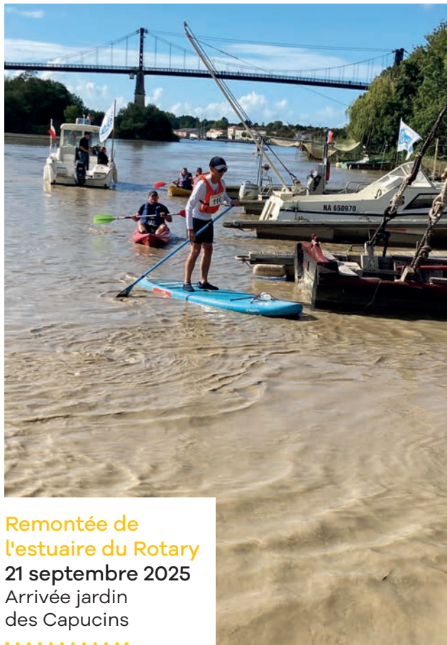
Remontée de l'estuaire du Rotary 21 septembre 2025 Arrivée jardin des Capucins .....