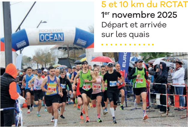
5 et 10 km du RCTAT 1 er novembre 2025 Départ et arrivée sur les quais .....